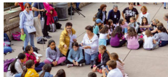
Participants al Tren Missioner, realitzant activitats a l'explanada del monestir

Al voltant de 400 persones, principalment infants i adolescents, van participar-hi procedents dels arquebisbats i bisbats de Barcelona, Girona, Lleida, Sant Feliu, Vic, Tarragona, Tortosa i l'Urgell, acompanyats per la majoria dels seus bisbes. Un total de 28 grups entre parròquies, escoles i altres grups de pastoral van poder gaudir d'un programa ple d'activitats que anaven des d'espais de música i ball, a estones de reflexió, una Eucaristia i un