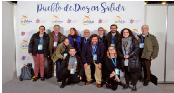
Congressistes del Bisbat de Sant Feliu de Llobregat

Un congrés on s'ha parlat de quatre itineraris: primer anunci, acompanyament, processos formatius i presència a la vida pública, dividits en 40 línies temàtiques. Cada qual podia triar dos tallers. «Ha estat una experiència molt positiva: ens hem ajuntat gent que no ens coneixíem, hem fet l'esforç de reflexionar sobre el que se'ns demanava i de sintetitzar-ho, per arribar a acords i pro-