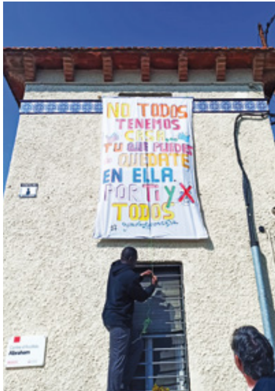
Pancarta que van realitzar els usuaris confinats al Centre d'acollida Abraham

és possible, amb les adequades mesures de protecció i segons els protocols de cada centre. Per exemple, al Parc Sanitari de Sant Joan de Déu , a Sant Boi de Llobregat, el Servei d'Atenció Espiritual i Religiosa (SAER) continua disponible mitjançant teleassistència per a les persones no afecta-