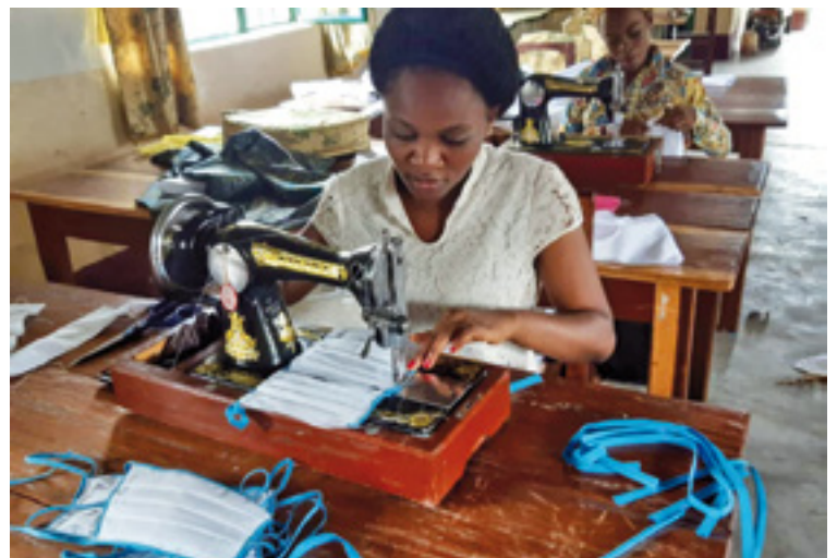
Projecte de Mans Unides al Camerun de confecció de mascaretes

Des de l'Índia, una de les situacions més preocupants és la de la massificació en els slums , barris marginals que proliferen al voltant de les grans ciutats. «El Govern ha anunciat que donarà paquets d'ajuda a les persones més pobres i als treballadors no sindicats,