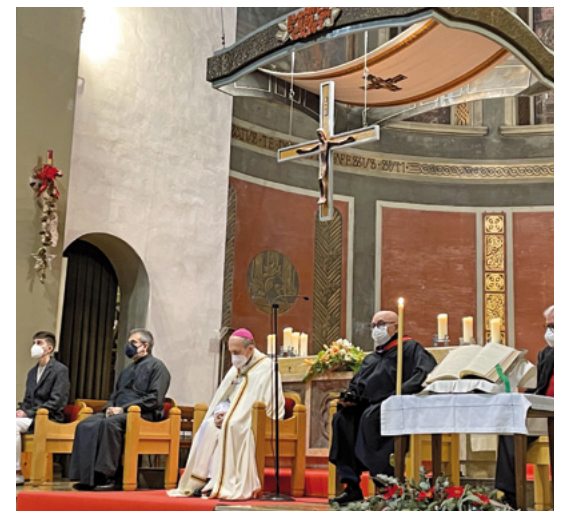
Pregària ecumènica a la Catedral de Sant Llorenç de Sant Feliu de Llobregat