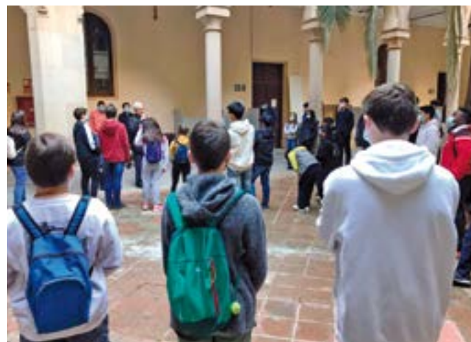
Trobada d'escolans 2021

Ja són 28 les trobades d'escolans que organitza el Seminari Conciliar! Dissabte 30 d'abril tindrà lloc la propera: un moment bonic per poder trobar-se, conèixer-se, jugar i pregar els escolans de les diverses parròquies de les diòcesis de Barcelona i San Feliu de Llobregat. El lloc de la trobada serà el mateix edifici del Seminari Conciliar de Barcelona (Carrer de la Diputació, 231), de les 10 a les 13.30 h, en una matinal d'activitats en format gimcana i amb l'eucaristia com a final. A la trobada hi són convidats tots els escolans i escolanes, i també s'hi poden afegir altres nois i noies d'entre 8 i 16 anys que estiguin vinculats a la parròquia.