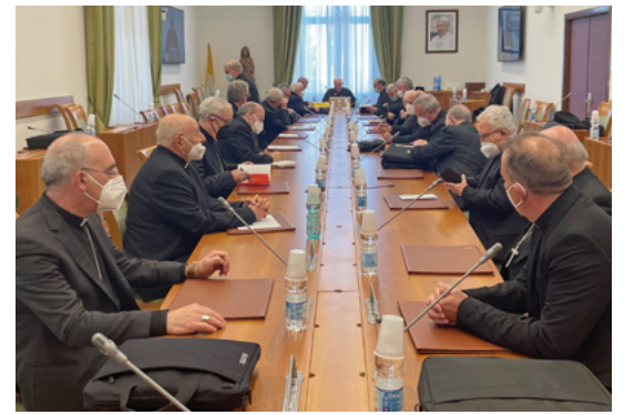
Reunió de la Congregació per als bisbes

—Congregació per a la Doctrina de la Fe, és un òrgan col·legiat de la Santa Seu, que vetlla per custodiar la correcta doctrina catòlica a l'Església. Allà es va parlar de la qüestió dels abusos i les conseqüències que comporta per a la societat.