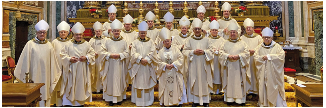
Els bisbes a Santa Maria la Major, on es va celebrar l'eucaristia dimecres 12 de gener

Planellas. Durant l'homília, va recordar que aquell temple és «mare i cap de totes les esglésies de la ciutat i del món», fent un resum històric d'aquella basílica. Després, dirigint-se a la resta de prelat, els va demanar que es preguntessin «si la nostra força com a pastors, com a Poble de Déu, com a Església Universal prové sempre de la riquesa alliberadora de Jesús», remarcant que cal saber «posar les nostres mans al servei de la profunditat de l'Església fundada i que descansa en el propi Senyor».